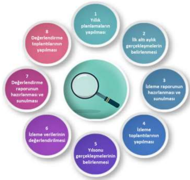
Şekil-4 İzleme ve Değerlendirme Süreci